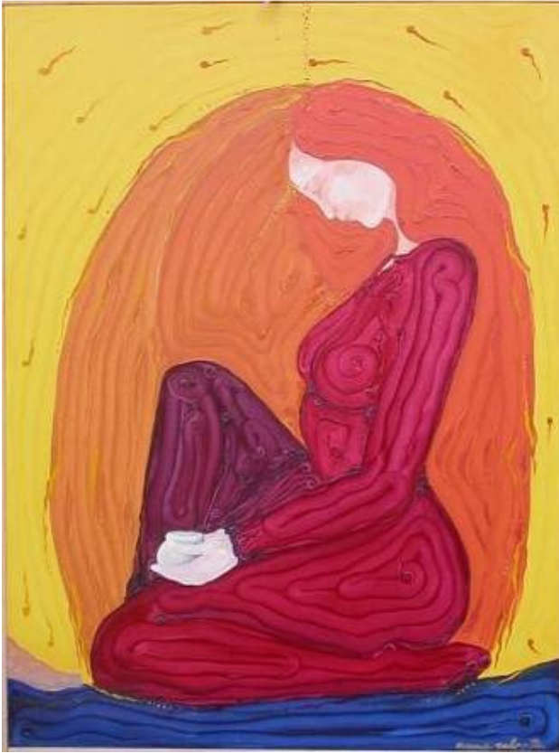
IN SUA MEMORIA olio su tela 60 x 80 Maria Maddalena col vasetto d'olio per l'unzione del Maestro