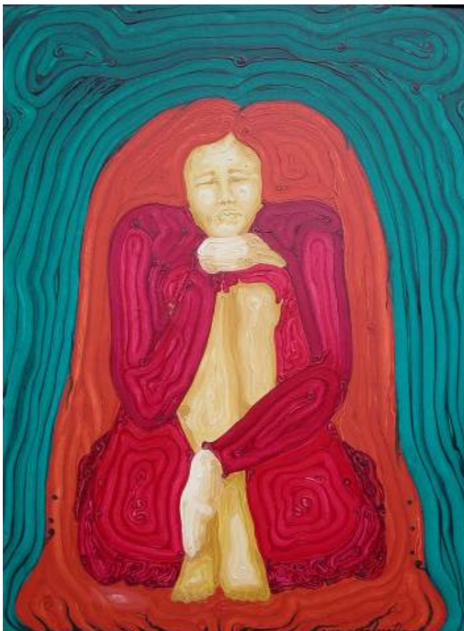
INTERIORIZZAZIONE RESURREZIONE olio su tela 60x80 Maria Maddalena si chiude nel silenzio per elaborare e capire quale sarà il Suo prossimo cammino.