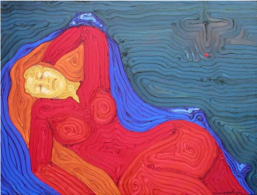
RICORDANDOTI olio su tela 60x80 Maria Maddalena si abbandona al ricordo del Suo amato.