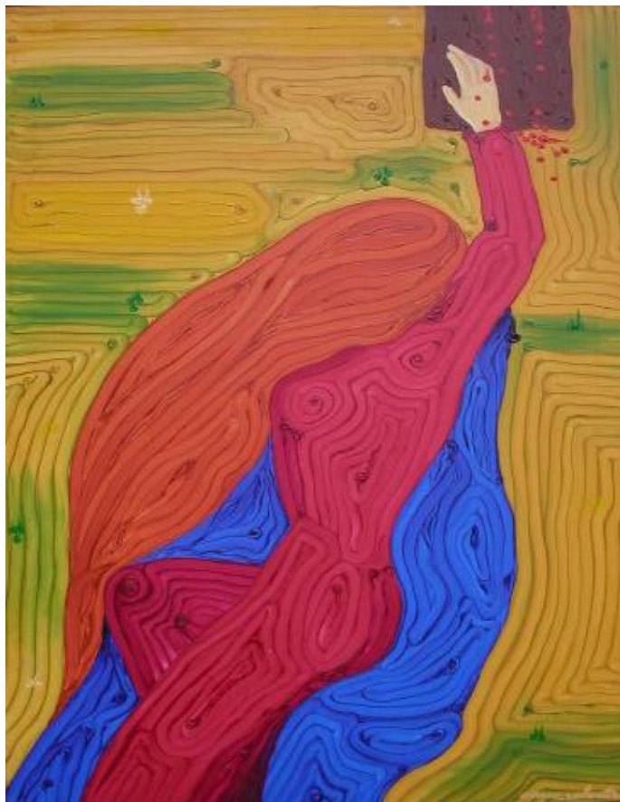
AI TUOI PIEDI olio su tela 80 x 100 Maria Maddalena disperata sdraiata ai piedi della croce.