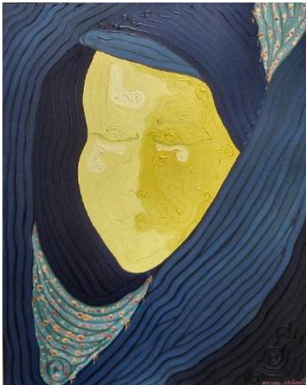
SENZA VELI olio su tela 80x100 Il mistero del volto ancora non rivelato di Maria Maddalena.